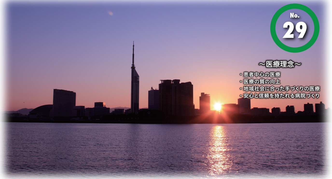
福岡市百道 - 初日の出