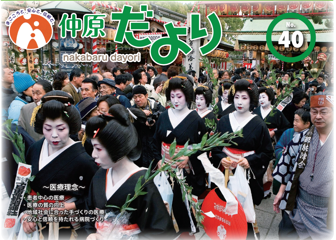
「十日恵比須・博多芸妓衆の徒歩(かち)参り」