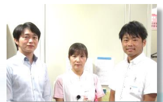
地域医療連携室スタッフ

医療ソーシャルワーカーは、主に入退院支援を担当します。退院時は、気持ちの整理や物、サービスなどの様々な準備が必要になる場合があります。そんなとき、院内の多職種やケアマネジャーをはじめとする、地域の医療・保健・介護サービス機関の各スタッフと協力し、在宅復帰に向けたお手伝いをします。退院後の生活や在宅療養で不安なことがありましたら、いつでもご相談ください。