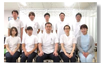
リハビリスタッフ

地域包括ケア病棟におけるリハビリの目的は、在宅復帰に向けて患者さんの運動機能や動作能力を専門的に評価し、その人らしい在宅生活が送れるように治療やサポートをしていくことです。退院する際に、在宅生活に何らかの不安を抱えている患者さんやご家族が多いと感じています。できるだけ退院後の生活を想定し、最大限の能力を発揮できるように希望に沿ったより良いリハビリを提供していきたいと考えています。