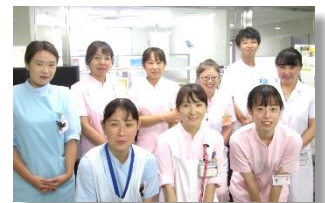
地域包括ケア病棟スタッフ

地域包括ケア病棟では、患者さんが退院後、安心して生活できるように必要なケアの指導、社会サービスの調整、リハビリなども柔軟に対応します。また、自宅療養中の患者さんを支える家族の休養のための入院も可能です。60日以内という入院期間の中で、早期に退院後の生活をイメージしながら、多職種スタッフでカンファレンスを重ね、患者さんが笑顔で退院されることを目標に看護を提供いたします。